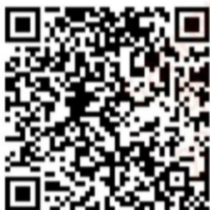
师德课堂直播二维码